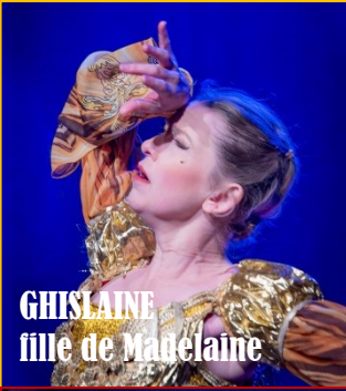
GHISLAINE fille de Madelaine

Au conservatoire, elle pratique la danse classique et contemporaine et découvre la danse baroque. Anne-Sophie Ott intègre en 2002 la Compagnie de danse l'Éventail sous la direction de Marie-Geneviève Massé et participe à toutes ses productions depuis. Ses différents spectacles l'ont amené à pratiquer les castagnettes, le jonglage, les claquettes irlandaises, l'escrime ainsi que le théâtre de masque.